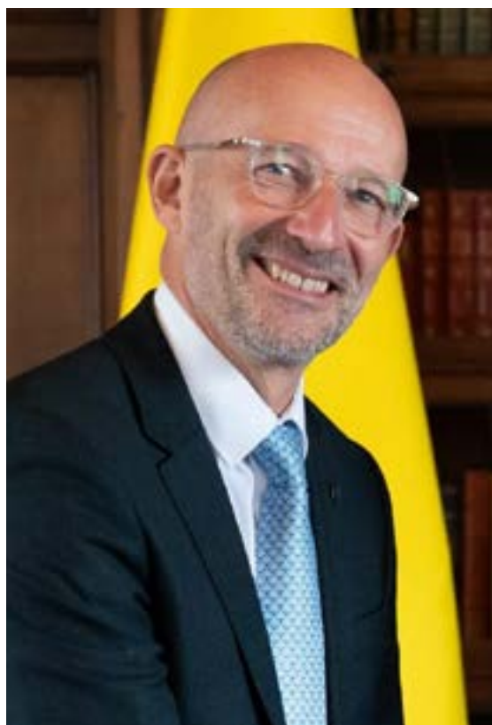
Gerold Vollmer, embajador de la República de Austria.