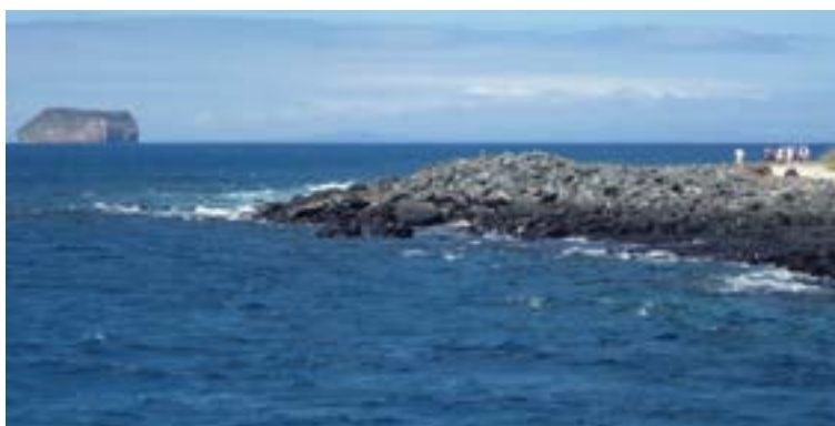
Parque Nacional Galápagos

El piso marino del Pacífico Sur oriental tiene una topografía extraordinaria: montañas, cumbres, mesetas y valles que albergan una gran varie-