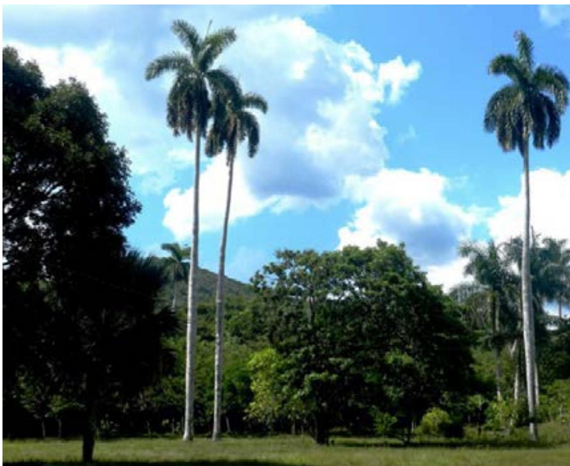
El bloque montañoso comienza a elevarse hace aproximadamente unos mil 200 millones de años.

Son senderos dentro de la franja de supervivencia que no afectan el círculo