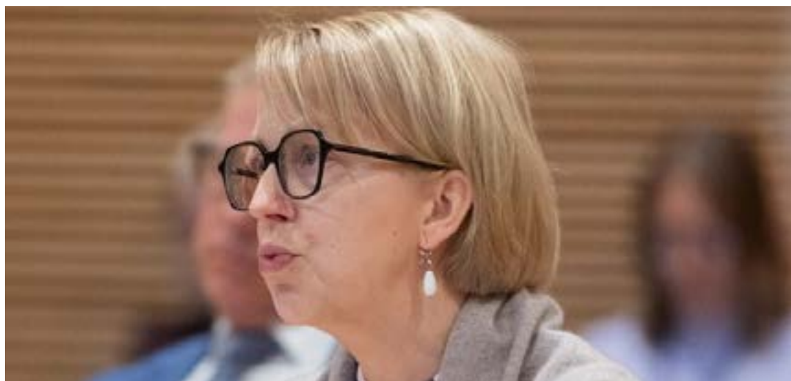
Eija Rotinen, embajadora de la República de Finlandia.