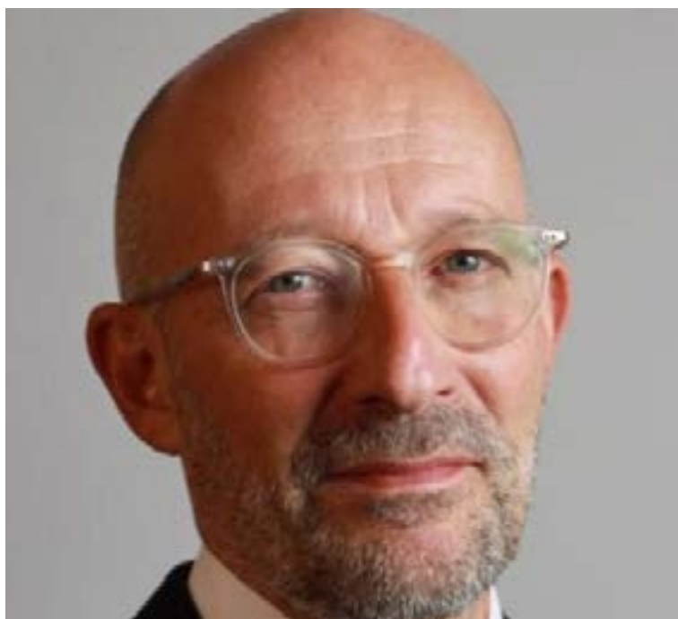
François Roudié, embajador de la Unión Europea.