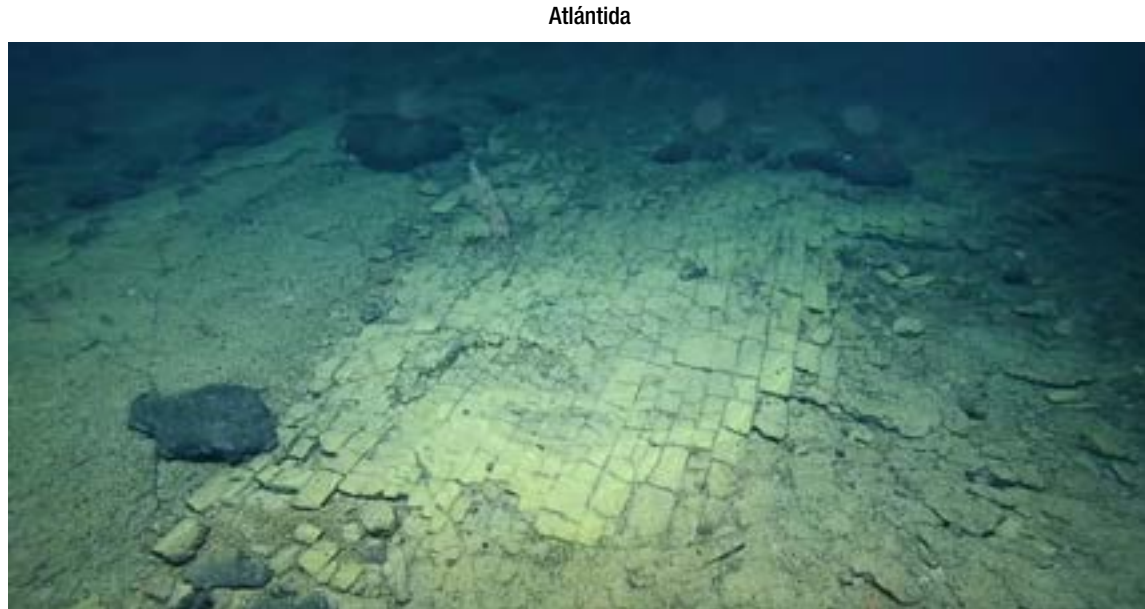
El camino a Atlántida descubierto por científicos.

Por muchos años, esta ciudad se consideró una metáfora de Platón para dar a entender sus ideas. Sin embargo, en el siglo XIX, varios investigadores notaron que en los escritos se hablaba de una historia verdadera. Esto los llevó a plantearse la posibilidad de encontrarla. Tras el increíble hallazgo, varios expertos del equi-