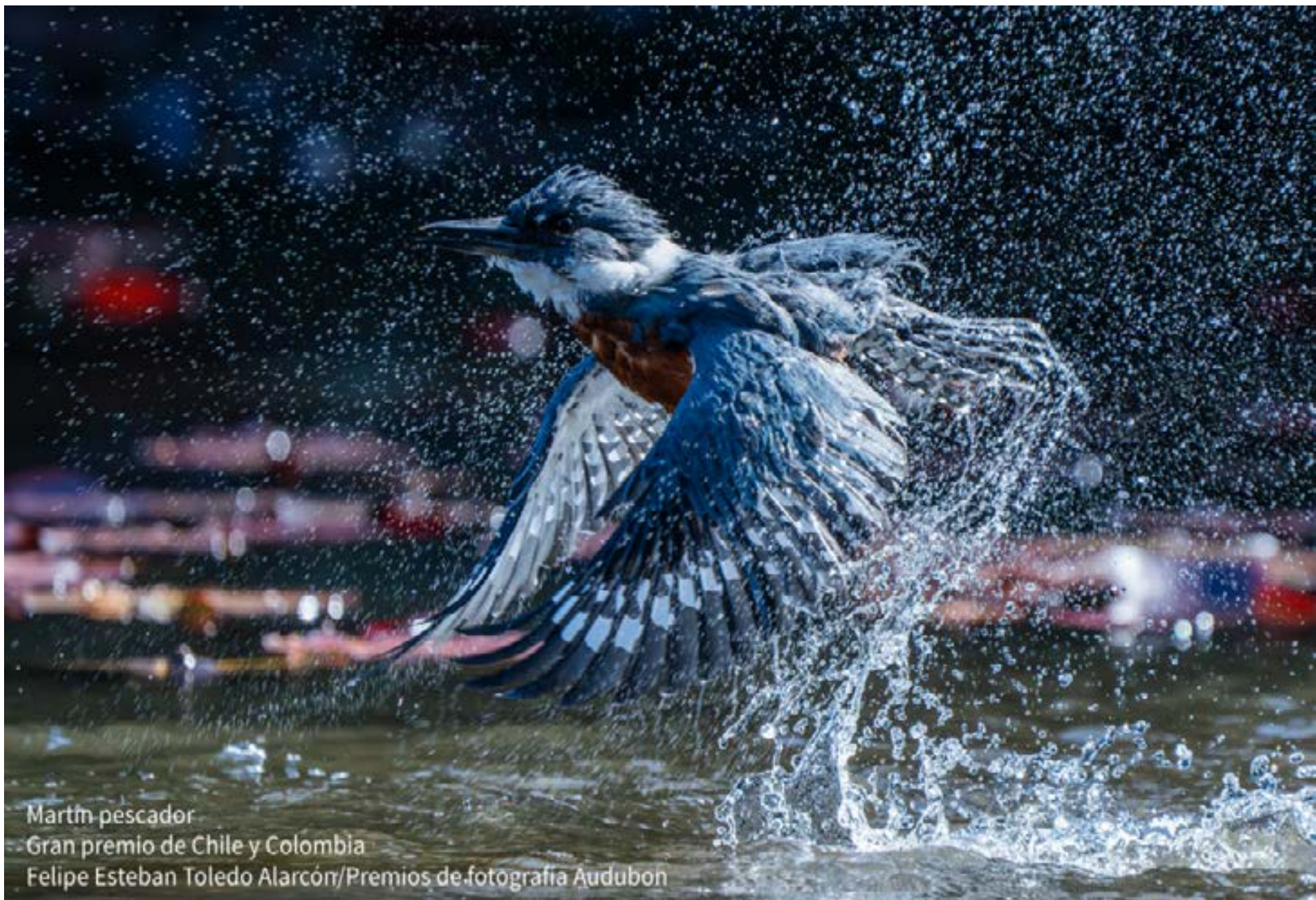
Martín pescador Gran premio de Chile y Colombia