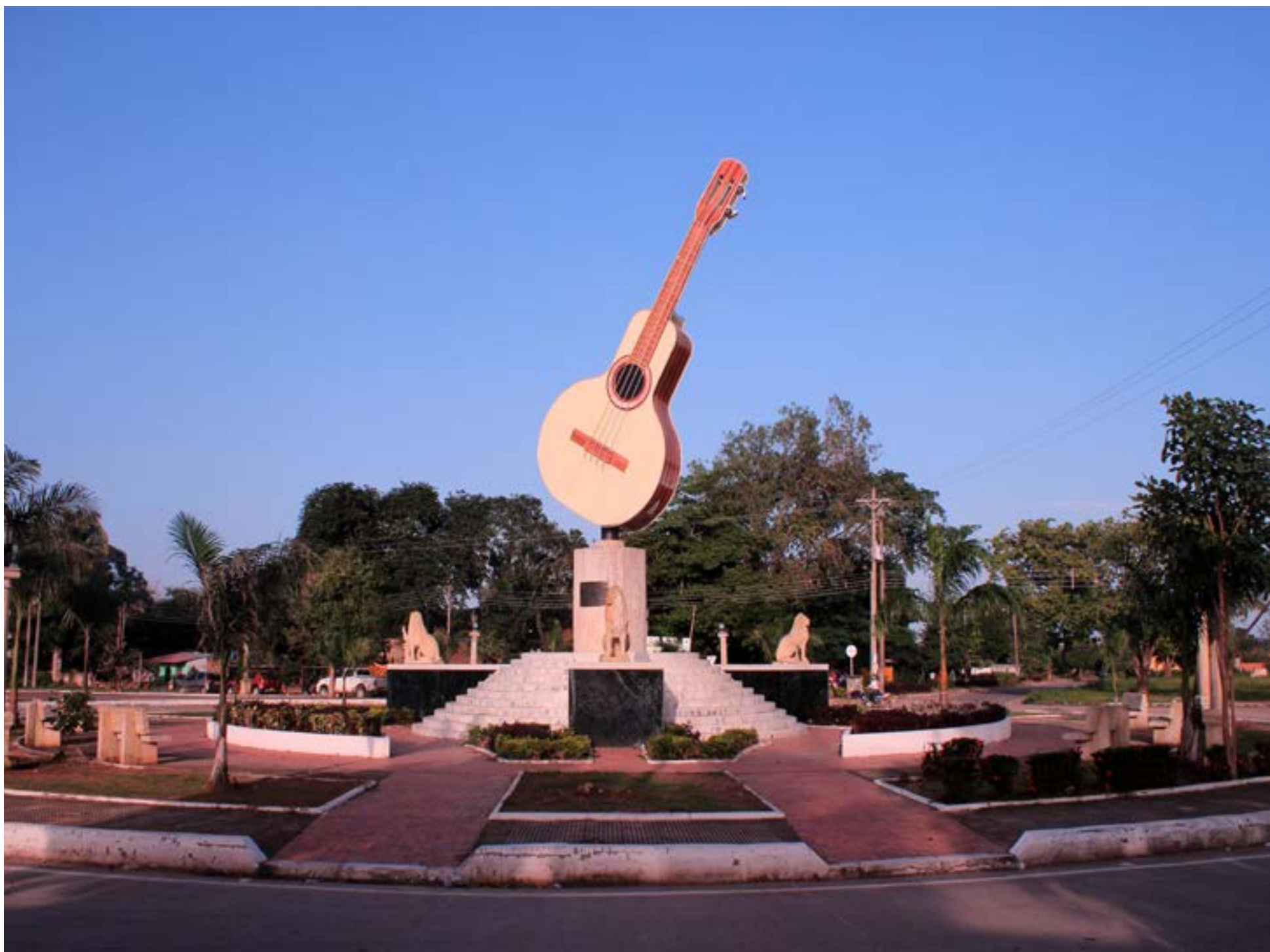
Monumento en honor a la variedad musical. Maní, Casanare.