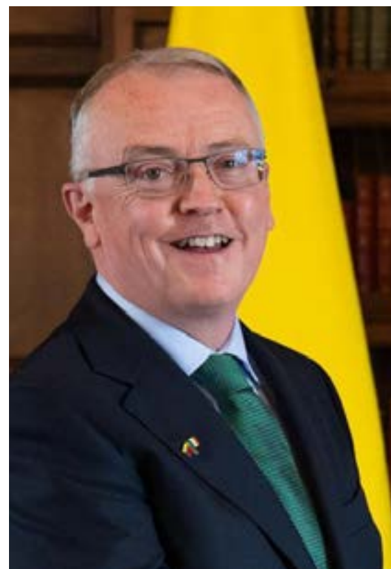
Cyril Brennan, embajador del Estado de Irlanda.