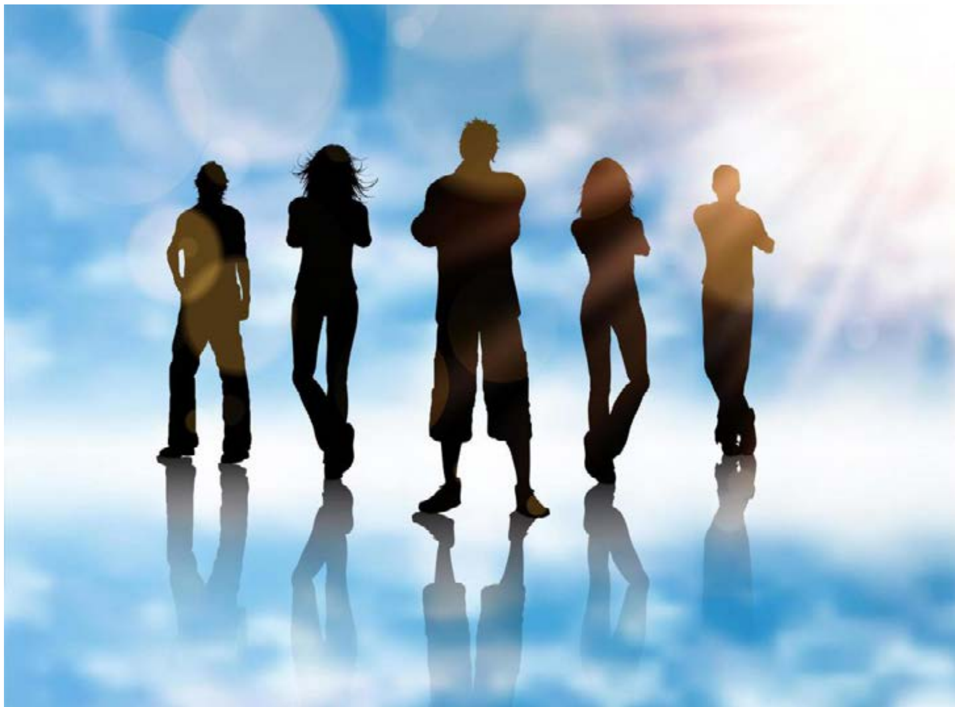
La nueva generación de los narcos: los invisibles.